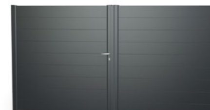
Portail alu - Modèle ADÉLAÏDE