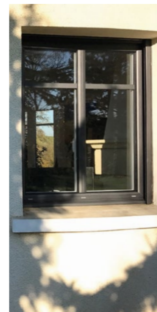
Fenêtre alu - Gamme RADIAN