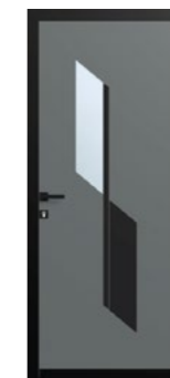
Porte alu - Modèle PAPILLIS