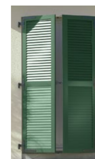
Volets battants alu - Modèle NATALIA