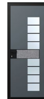
Porte alu - Modèle SAMOURAI